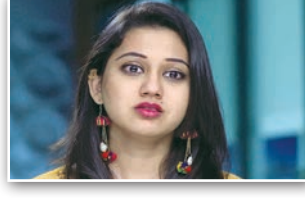
मुंबईसह राज्यातील इतर जिल्हांमध्येही तिच्या विरोधात गुन्हा दाखल करण्यात आला आहे. याप्रकरणी सत्र न्यायालयाने तिला

■ ठाणे अभिनेत्री केतकी चितळेच्या अडचणीत आणखी भर पडली असून 'अॅट्रॉसिटी' प्रकरणी अटकत असलेल्या केतकीला ठाणे सत्र न्यायालयाने ५ दिवसांची पोलिस कोर्टाडी सुनावली आहे. ठाणे मध्यवर्ती कारागृहातून तिला रबाळे पोलिसांनी गुरुवारी ताब्यात घेतले होते. त्यानंतर तिला आज न्यायालयात हजर करण्यात आले. राष्ट्रवादीचे अध्यक्ष शरद पवार यांच्याविरोधात आक्षेपाई पोस्ट लिहिण्याप्रकरणी केतकीला पोलिसांनी अटक केली आहे. १४ दिवसांची न्यायालयीन कोर्टाडी सुनावली होती. अशात २०२० मध्ये दाखल झालेल्या 'अॅट्रॉसिटी' च्या गुन्हा प्रकरणी रबाळे पोलिसांनी गुरुवारी कारवाई करत तिला ठाणे कारागृहातून ताब्यात घेत अटक केली. आज ठाणे न्यायालयात हजर केले असताना तिची पाच दिवसांसाठी पोलिस कोर्टाडीत रवानगी केली. तिने २०२० मध्ये सोशल मीडियावर अनुसूचित जातींच्या व्यक्तींविरोधात आक्षेपाई पोस्ट केली होती.