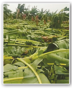
खांडित झाला. रत्नागिरी आणि रायगडमध्येही पाऊस पडल्यामुळे उकाड्याने हैराण झालेल्या

■ मुंबई महाराष्ट्राच्या जालना, सांगली, सिंधुदुर्ग, सोलापूर, कोल्हापूर, अहमदनगर आदी ठिकाणी मान्सूनपूर्व पावसाने दमदार हजेरी लावली. सांगलीत सलग १४ तास पाऊस पडला. पंढरपुरात सोसाट्याच्या वाऱ्यासह पडलेल्या पावसामुळे केळीच्या बागा आडव्या झाल्या. द्राक्ष, डाळिंब बागांनाही पावसाचा फटका बसला. महाबळेश्वरमध्ये पाऊस आणि गडद धुकें पडले. कोकण, पश्चिम महाराष्ट्र आणि मराठवाड्याच्या अनेक भागांमध्ये पाऊस पडला. जालन्यात विजेच्या तारा तुटल्यामुळे शहराचा वीजपुरवठा नागरिकांना दिलासा मिळाला. राज्याच्या अनेक भागांत काल दुपारपासून ढगाळ वातावरण होते. पंढरपूर तालुक्यात सायंकाळपासून वादळी वाऱ्यासह पावसाला सुरुवात झाली. त्यात अनेक एकर केळीच्या बागा भुईसपाट झाल्या. त्यामुळे शेतकऱ्यांचे मोठ्या प्रमाणावर नुकसान झाले. सांगलीत १४ तास पाऊस पडला. त्याचा मोठा फटका शेतीला बसला. मुसळधार पावसामुळे सांगलीतील नदी नाले, तलाव तुडुंब भरून वाहू लागले होते. तर तीर्थक्षेत्र गुड्डापूरही