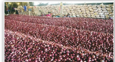
प्रमाणे कांदा विकवावा लागत आहे. तर काही ठिकाणी शेतकऱ्यांनी विक्रीसाठी आणलेल्या लहान कांद्याला ५१ रुपये क्विंटल म्हणजेच किलोमागे फक्त ५